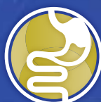
MALADIE DE CROHN