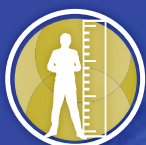
TROUBLES DE LA CROISSANCE